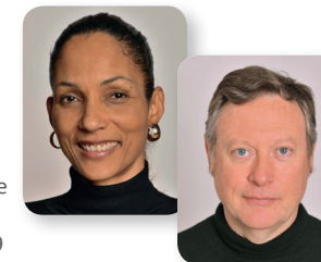
Christine ARRON - Adjointe aux sports Athlète, championne du monde, médaillée olympique

« Pour une politique culturelle et sportive dynamique et innovante »